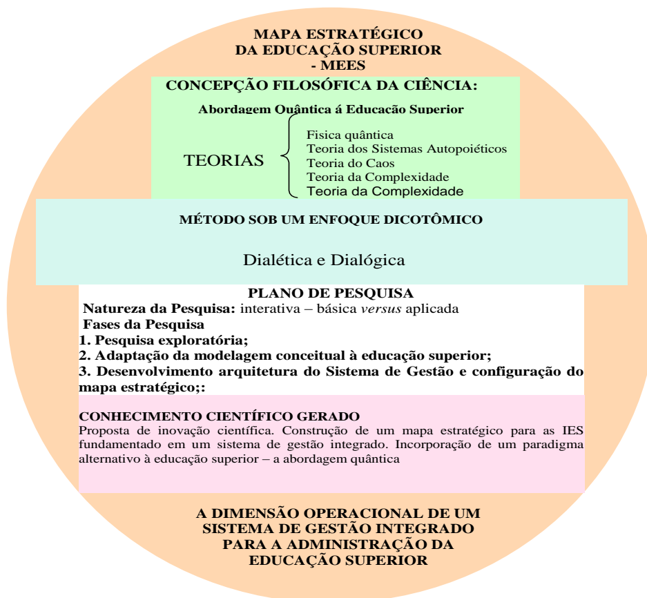
Figura 1: Delineamento Metodológico da dimensão operacional de um Sistema de Gestão Integrado para a Administração da Educação Superior: Arquitetura do MEES

A Figura 1 apresenta o delineamento metodológico deste estudo. A abordagem quântica da ciência integra várias linguagens (teorias) sem uma fronteira nítida entre elas, observando-se redundâncias e interconexões. As teorias inseridas em uma determinada abordagem do conhecimento reflete um paradigma científico, ou seja, um modelo de mundo, percepções e valores inerentes à um contexto histórico e social.