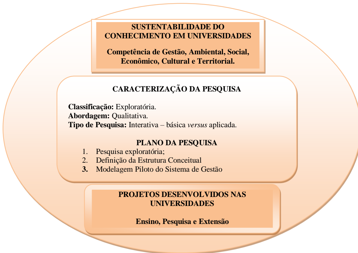
Figura XX – Delineamento da pesquisa sobre a sustentabilidade do conhecimento em universidades.